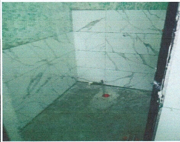
Foto 5: Area de donde se esta realiznado el mantenimiento y cambio de sanitarios