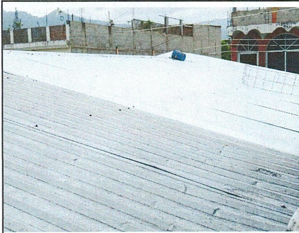
Foto 1: Area de donde se esta realizando el mantenimiento y cambio de lamina.