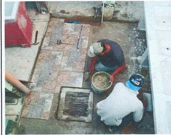
Foto 4: Area de donde se esta realizando el mantenimiento y cambio de piso en el area de lavamanos.

Observación: Si es necesario se pueden agregar hojas adicionales y actualizar el número de hojas.