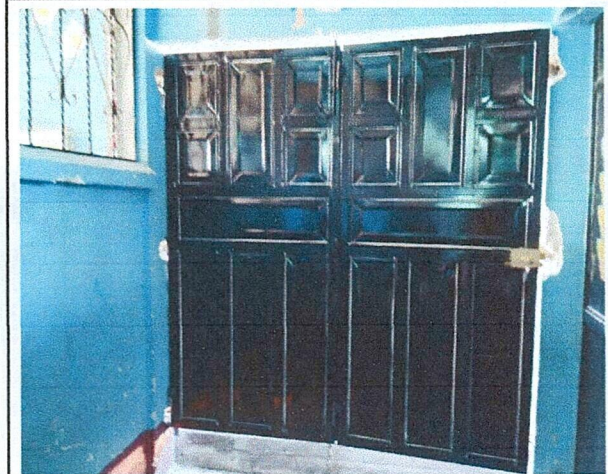
Foto 3: Area de donde se esta realizando el cambio e instalación de portones.