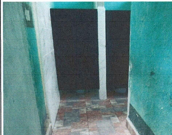
Foto 7: Area de donde se esta realizando el mantenimiento de puertas y paredes en el area del baño.