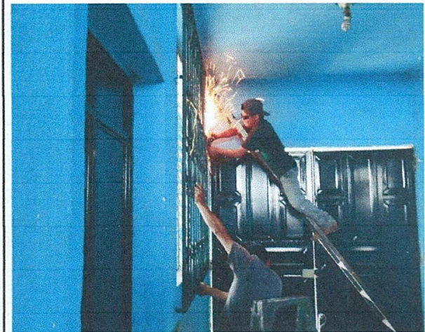
Foto 8: Area de donde se esta realizando el mantenimiento y pintura de balcones.

Observación: Si es necesario se pueden agregar hojas adicionales y actualizar el número de hojas.