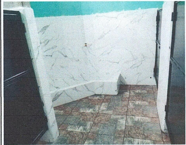
Foto 6: Area de donde se esta realizando el mantenimiento y cambio de losa en el area de mingitorio.